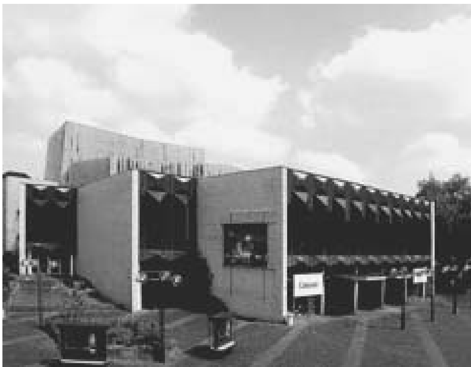
Das Theater in Krefeld

Gemeinsame Erklärung der Fraktion DIE LINKE im Rat der Stadt Mönchengladbach und der Ratsgruppe im Rat der Stadt Krefeld