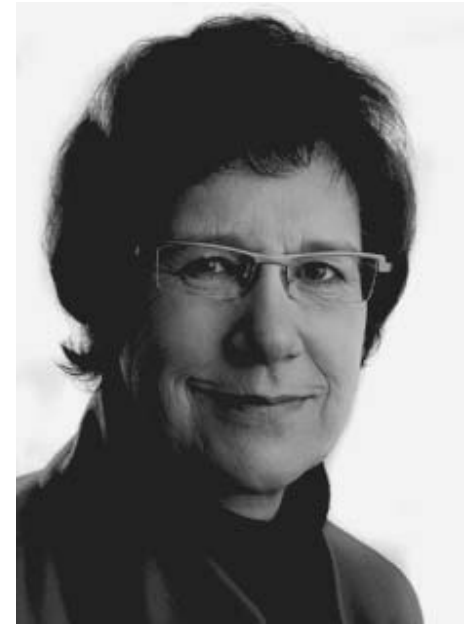
Gunhild Böth Mitglied des Landtages von Nordrhein-Westfalen

5. Wir beantragen die Streichung aller Auswahlgebühren egal ob bei ausländischen Studierenden oder BewerberInnen künstlerischer Studiengänge. Es kann nicht sein, dass für bestimmte Personengruppen oder Studiengänge eine Auswahlgebühr erhoben wird und für andere nicht. Hier muss eine ein-